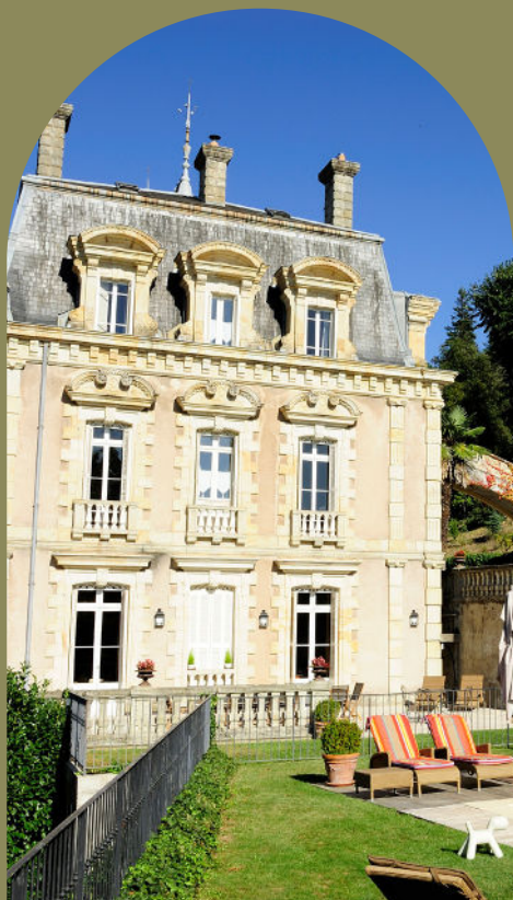
CHÂTEAU CLÉMENT VALS-LES-BAINS