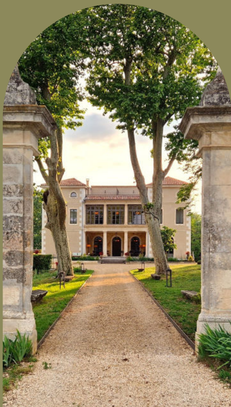
HÔTEL VILLA WALBAUM**** VALLON-PONT-D'ARC