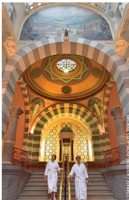
Les Thermes du Mont-Dore classés Monuments Historiques - Peintures, mosaïques et fresques polychromes, datant pour certaines du XIX e siècle, charpente à la Gustave Eiffel, vastes salles aux plafonds peints, coupoles, marbres...

Le style architectural fait parfois, aussi, référence au passé de la cité thermale, comme à Royat-Chamalières, où subsistent encore de nombreux témoignages des thermes romains installés ici autrefois. En réponse à cette lointaine époque, les thermes abritent des statues et fresques inspirées de l'Antiquité et la buvette Eugénie, qui abritait la source jaillissante, prend des allures de temple antique. Semblant traverser les siècles, les stations