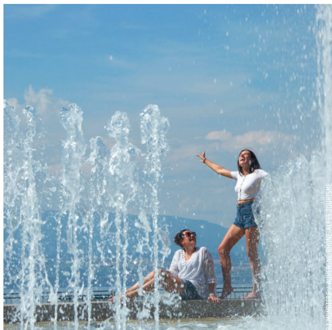
Un jardin-promenade aménagé et ombragé à Thonon-les-Bains : vue panoramique sur le lac Léman, le port de Rives, la ville de Lausanne, les monts du Jura...