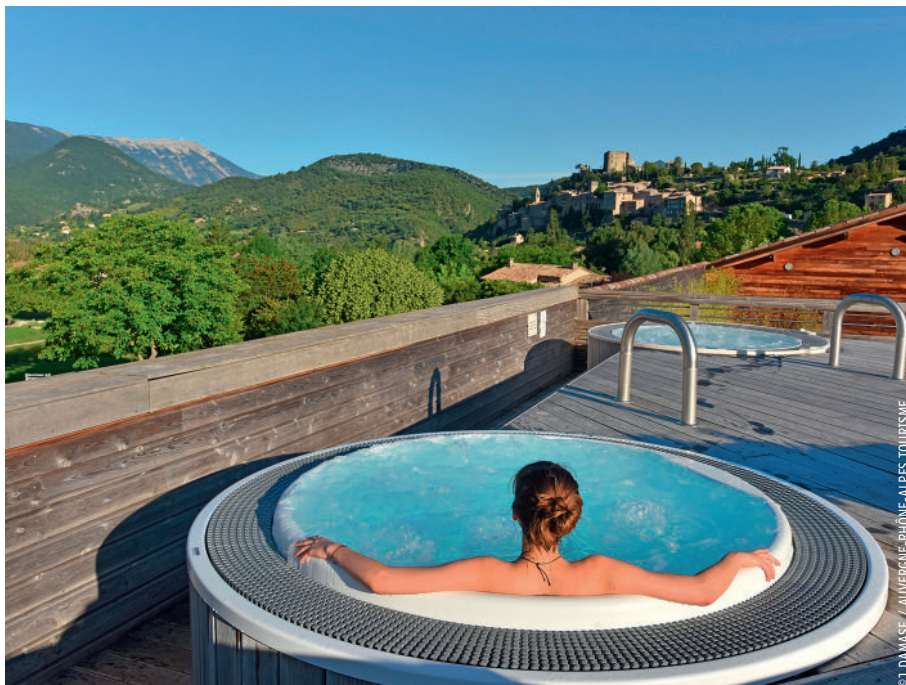
Vue panoramique sur le Mont-Ventoux et le village de Montbrun-les-Bains depuis le jacuzzi du spa thermal Valvital.

Déambuler dans les rues d'une ville d'eaux, c'est s'offrir un voyage dans le temps, entre kiosques à musique, casino, théâtre à l'italienne et parterres fleuris. La ville thermale de Nérès-les-Bains, dans l'Allier, témoigne bien de ce plongeon dans l'atmosphère du XIX e siècle. Elle a su conserver les traces de l'âge d'or du thermalisme, au travers, notamment, du beau théâtre à l'italienne, datant de 1898 et dont la rénovation a permis d'en conserver toute l'acoustique. Le charme si particulier de la Belle Époque, caractéristique des villes