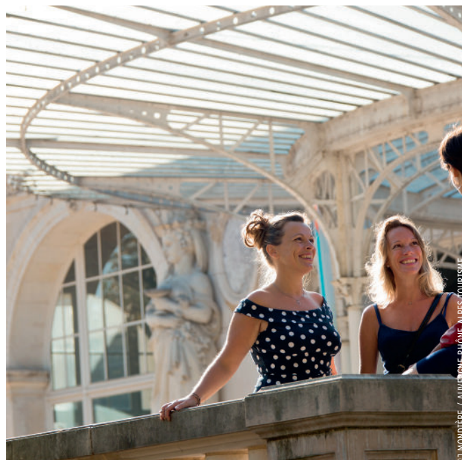
Opéra de Vichy, pur joyau de l'Art nouveau unique en France. Il présente une décoration déclinée dans une harmonie d'or, d'ivoire et de jaune.

male de Bourbon-l'Archambault. Cette ancienne capitale des ducs de Bourbon possède des bains depuis l'époque de l'Empire romain, mais c'est bien son château médiéval, toujours debout, qui témoigne aujourd'hui de cet illustre passé.